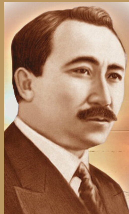
Сәкен Сейфуллин 1894-1938

“С. Сейфуллин атындағы орталықтандарылған кітапханалар жүйесі” ҚММ